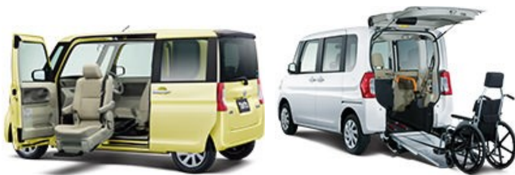
ダイハツの福祉車両 左:昇降シート車 右:車椅子移動車

う技術開発は自動車各社にとっては確実に需要が見込め、技術が蓄積されれば日本の新たな競争力になることも期待されます。高齢ドライバー対策で生まれる新たな技術開発に注目です。