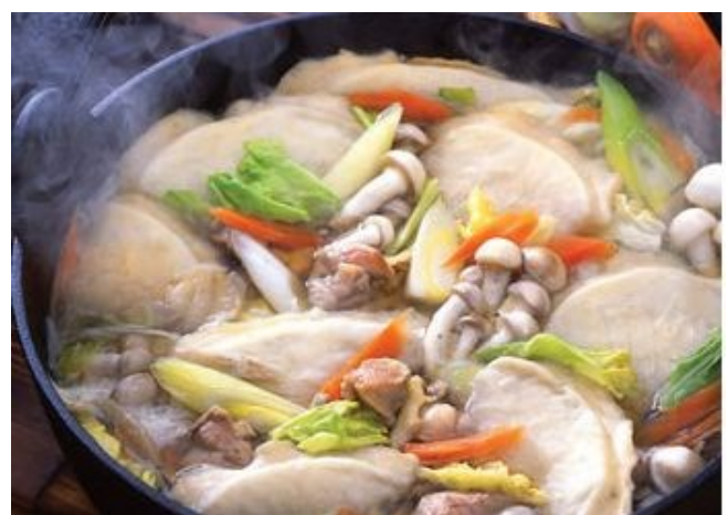
2012年優勝の八戸せんべい汁

こうした悪循環を断ち切って、新たなご当地グルメが誕生するのか。大型予算をバックに、各地域の「本気」が試される年となりそうです。