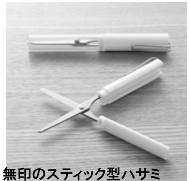
無印のスティック型ハサミ (税込500円)

小さくしたくらいのスリムサイズ。キャップを外すとバネの力で刃が開きっぱなしになるので、柄を握る力で刃を動かす仕組みになっています。