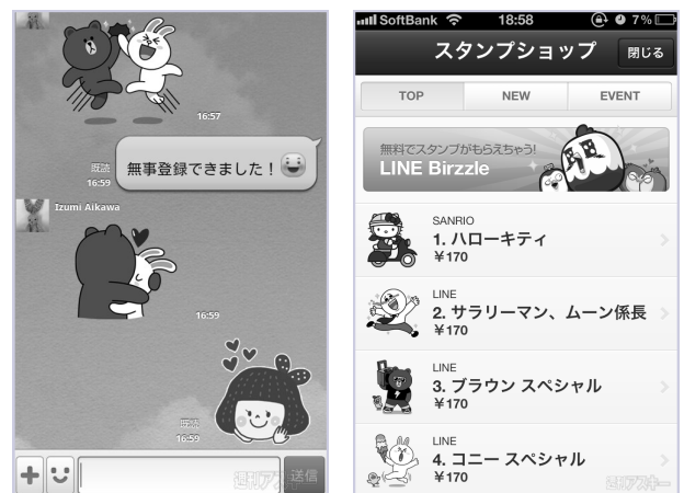
チャット(左)と稼ぎ頭のスタンプショップ(右)

日本が放つ久々のグローバル商品は、若年層をしっかりつかんでさらなる躍進を遂げていきそうです。